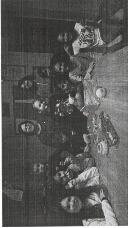
Мастер - класс "Совушка" для гостей Монтеessori-школы г.Казани